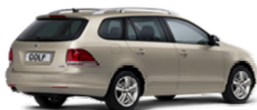
Außenlackierung Moon Rock Silver Metallic