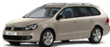
Außenlackierung Moon Rock Silver Metallic