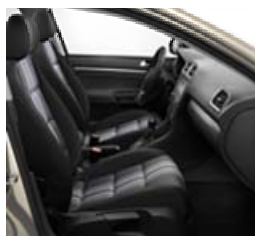
Innenausstattung Schwarz-Grau/Titanschwartz/Schwarz/ Perlgrau